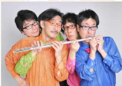
アンサンブル・リュネット